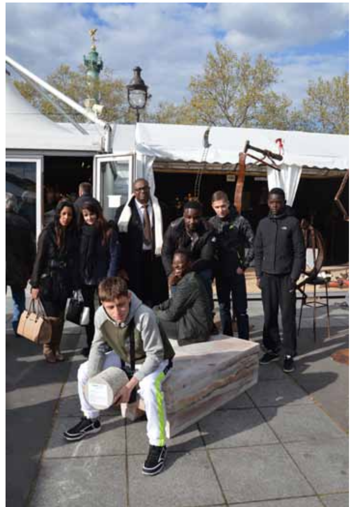
Tous à la Bastille !