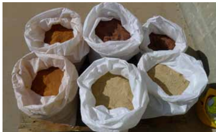
Gravats réduits en poudre