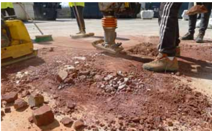
Concassage de gravats