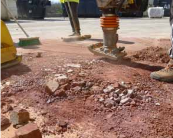
Prototype fraîchement décoffré