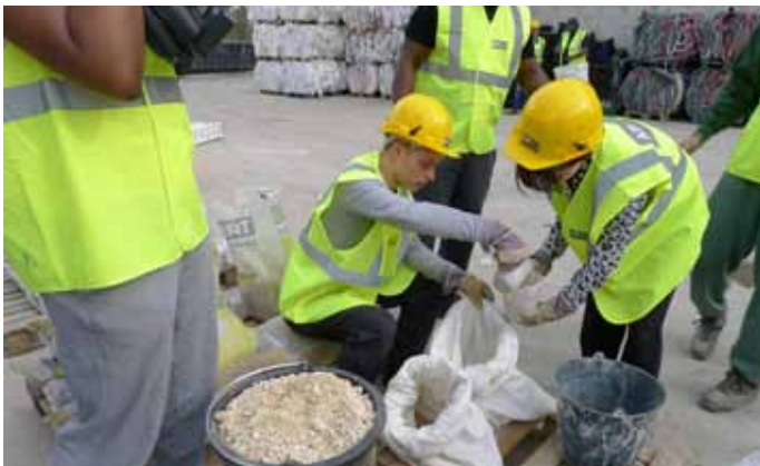
Préparation des mélanges