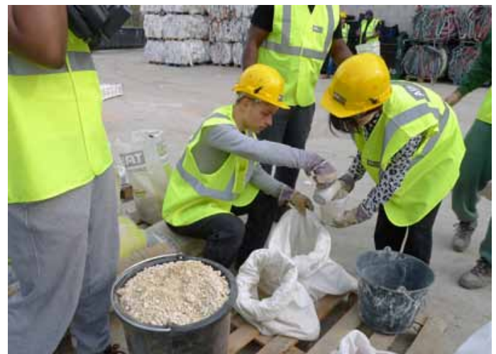
Prototype marbre d'ici / Cergy 2016 - 001