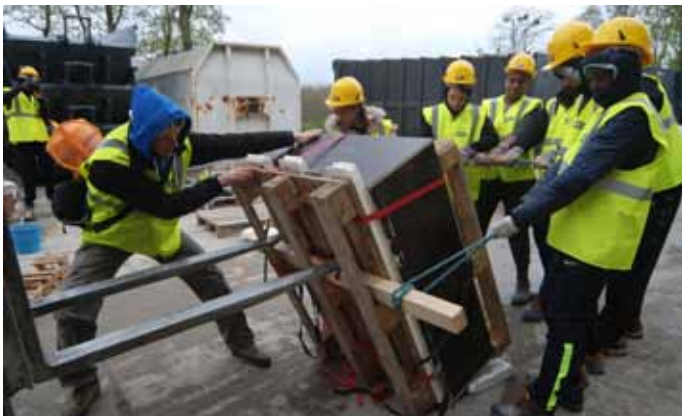
Retournement des blocs